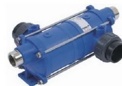
Теплообменники - нагреватели для бассейна