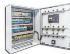
Автоматика теплового пункта

Нужна помощь в подборе оборудования - ОСТАВЬТЕ ЗАЯВКУ, МЫ ПОМОЖЕМ РАЗОБРАТЬСЯ