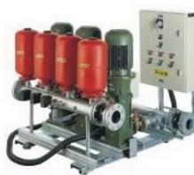
Насосы и насосные станции