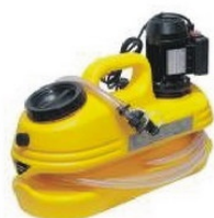
Все для промывки теплообменников