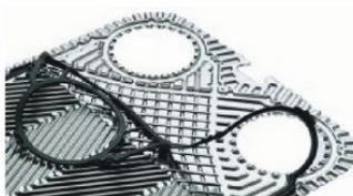
Пластины и уплотнения для теплообменников