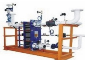
Тепловые пункты ИТП, ЦТП, БТП