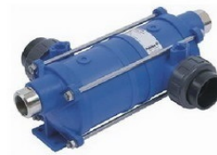
Теплообменники - нагреватели для бассейна