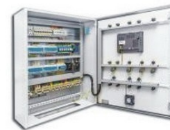
Автоматика теплового пункта

Нужна помощь в подборе оборудования - ОСТАВЬТЕ ЗАЯВКУ, МЫ ПОМОЖЕМ РАЗОБРАТЬСЯ