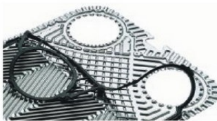
Пластины и уплотнения для теплообменников