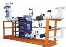
Тепловые пункты ИТП, ЦТП, БТП